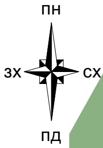
Схема організації руху транспорту та пішоходів М 1:500